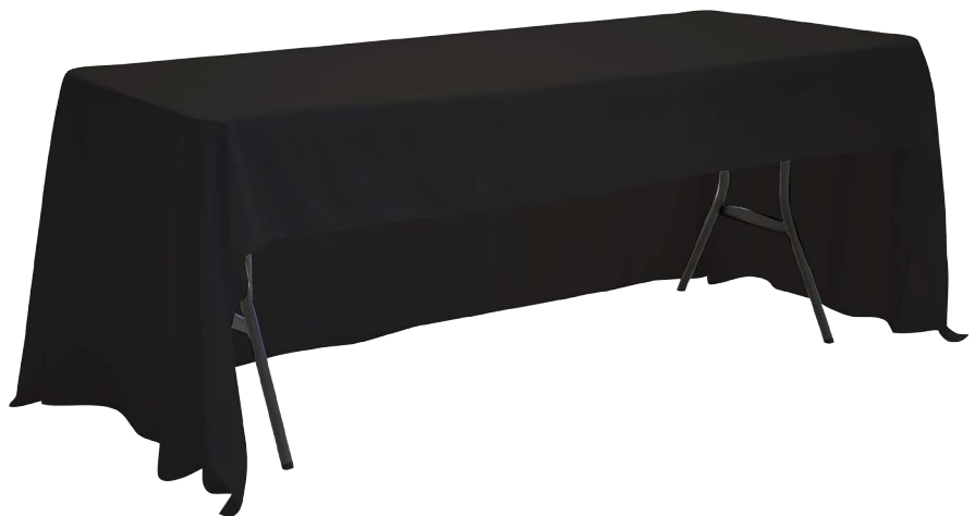
TABLE COVER ECONOMY AND ROYAL ECONOMY